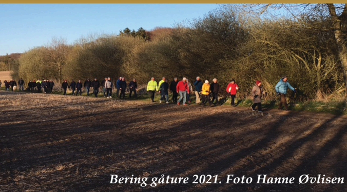
Bering gåture 2021.

Med foråret er det tid til at rykke udendørs, og igen i år vil der blive planlagt og afholdt gåture i samarbejde med Bering GT. Læs mere om dette på vores hjemmeside eller på opslag.