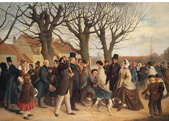
Da Københavns Vold for Store Bededag 1862 - A.H. Hønnæus - (SMK)

For et års tid siden trak en helligdag store overskrifter herhjemme. Store Bededag blev en politisk meget varm kartoffel og trods stor modstand valgte regeringen som bekendt at afskaffe den godt 300 år gamle danske helligdag.