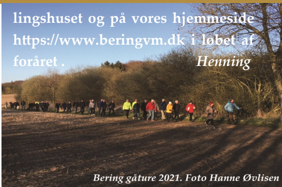
Bering gåture 2021.

lingshuset og på vores hjemmeside https://www.beringvm.dk i løbet af foråret. Henning