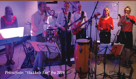
"Stakkels Far" fra 2019

Fredag den 2. februar 2024 kommer søskendeorkesteret "Stakkels far" og giver koncert i Bering Forsamlingshus.