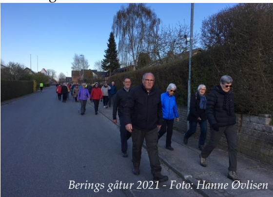
Berings gåtur 2021

Der var ingen tvivl om, at Kierkegaard selv var glad for at gå, og med skrivelsen til sin svigerinde påpeger han, at en gåtur ikke alene påvirker den almene fysiske sundhedstilstand, men at den samtidig også kan have en god indflydelse på selv det tungeste sind.