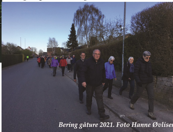
Bering gåture 2021.

Sidste tur er den 5. juni med start fra Drammelstrupvej 256 i Solbjerg, hvor der også sluttet af med grillarrangement. Bente og Jens Ejnar tænder op i grillen og der kan efter gåturen købes grillpølser, øl og sodavand.