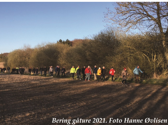
Bering gåture 2021.

Den 1. maj startede vi i Stilling og den 8. maj var der start på Brydehøjvej i Edslev.