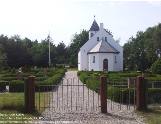
Børsmose kirke

Vi starter fra forsamlingshuset ved Bering Kirke søndag morgen kl. 8.00 og kører til Børsmose Kirke i Oksbøl, hvor vi deltager i højmessen kl.10.30.