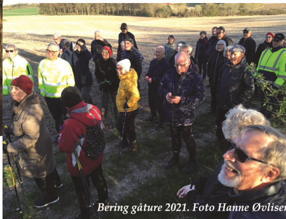
Bering gåture 2021.

Turene starter alle klokken 19.00. Læs mere om turene på beringgt.dk . Vi skal dog lige advare om, at der kan opstå hygge og snakken undervejs. Skal du med? - Du kan nå det endnu.