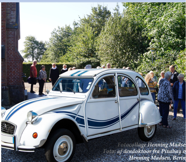
Fotocollage Henning Madsen