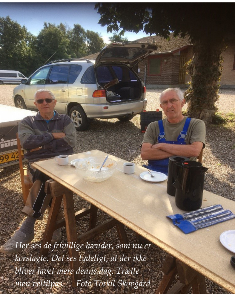
Her ses de frivillige hænder, som nu er korslagte. Det ses tydeligt, at der ikke bliver lavet mere denne dag. Trætte men veltilpas.

En lille fortælling om en god dag blandt de ”frivillige hænder”. Æblekagen blev spist - nej - de åd det hele og skålen blev nærmest slikket, men det var velfortjent. Helt ”reeeeng” var den åbenbart ikke.