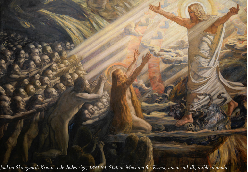
Joakim Skovgaard, Kristus i de dødes rige , 1891-94, Statens Museum for Kunst, www.smk.dk , public domain:

Billedkunstneren Joakim Skovgaard, Forrest ses Eva og Adam, ved hvem 1856 – 1933, malede sit kæmpeværk syn den kom ind i verden. Sammen "Kristus i de dødes rige" i årene 1890 med alle de mange andre døde ræk- - 94 . Han var stærkt inspireret af ker de deres arme frem mod Kristus, Grundtvigs store digt, "I kvæld blev det livgivende lys. der banket på helveds port".