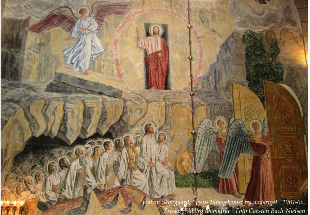
Joakim Skovgaard, "Jesus tilbagekomst fra dødsriget" 1901-06. Fresko, Viborg Domkirke

I 1906, i forbindelse med den indvendige udsmykning af Viborg Domkirke, malede J. Skovgaard "Jesu tilbagekomst fra de dødes Rige" i domkirkens kor.