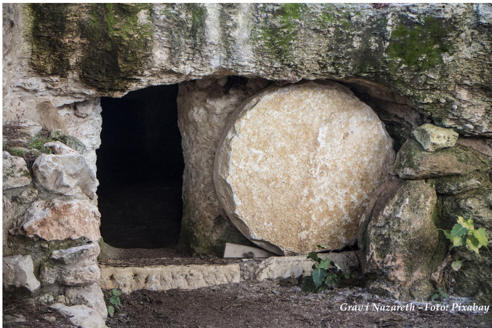
Grav i Nazareth

Ikke alene føler vi, at døden har magten over os, har sejret. Døden ér vores vilkår. I digtet er det min og din død, der er tale om. Når vi er døde, og der er sat en sten på vores grav, holdes vi ikke blot på plads i jorden på grund af dødens skyld, menneskets fejl og fald. Men fordi vore hjerter er kolde.