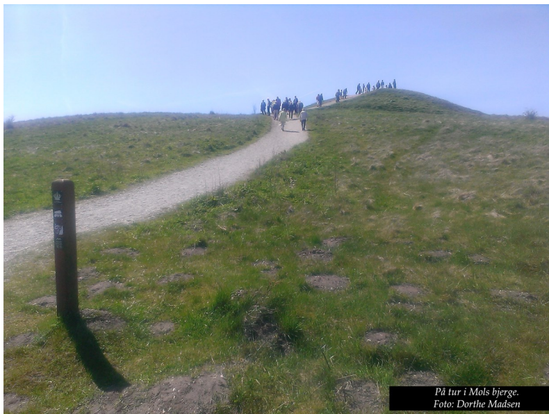
På tur i Mols bjerge.