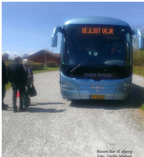
Bussen klar til afgang

Kristi Himmelfartsdag havde Valgmenigheden valgt at markere ved at drage til Mols.