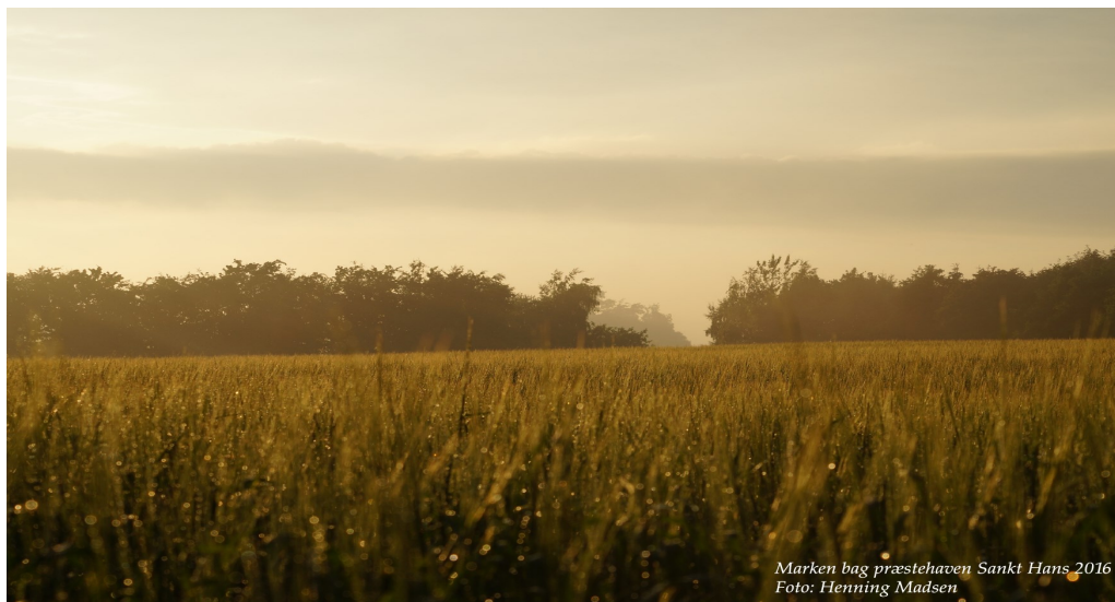
Marken bag præstehaven Sankt Hans 2016

I år er Bering Valgmenighed vært for den traditionelle højskoledag for de Østjyske Valgmenigheder.