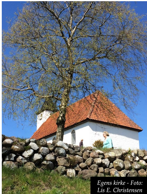
Egens kirke

Derpå til Knebel, hvis kirke rummer en meget spændende og utraditionel altertavle af Bjørn Nørgaard.