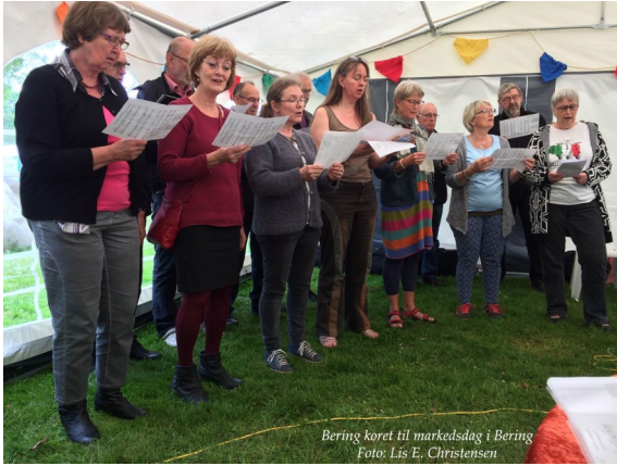
Bering koret til markedsdag i Bering

ter vi klokken 19.15. Dog holdes fri i uge 42, hvor mange holder efterårsferie.