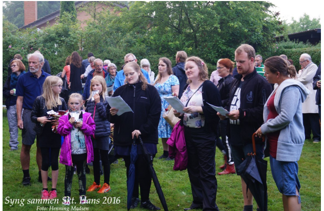
Syng sammen Skt. Hans 2016