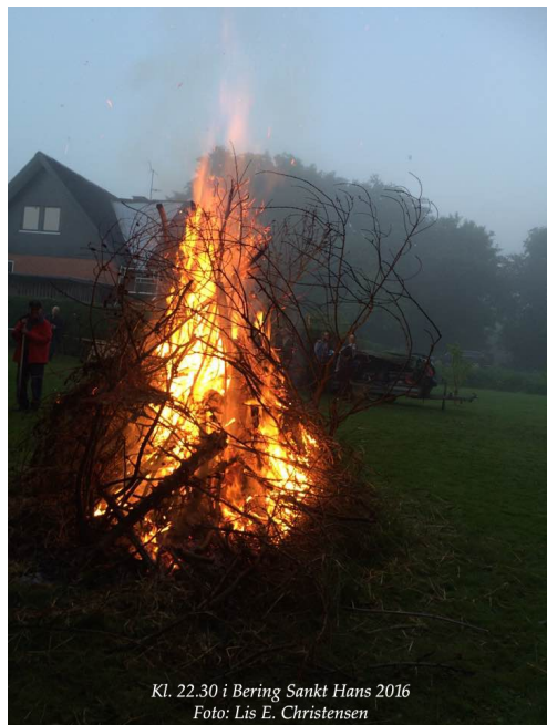
Kl. 22.30 i Bering Sankt Hans 2016