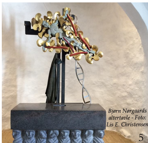
Bjørn Nørgaards altertavle

Godt Margrethe var med og kunne gøre rede for tankerne bag værket!