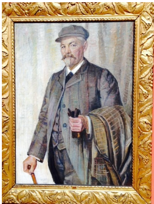
Selvportræt fra 1908