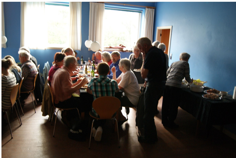
Skærtorsdags fællesspisning i Bering 2011