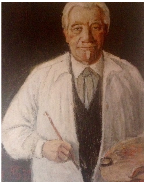
Det sidste selvportræt fra 1932

I tre år, fra 1902-04, var han hver sommer i Viborg. Vennen Joakim Skovgaard havde fået overdraget udsmykningen af domkirken, og for PSC var det så stort, at han måtte være vidne til det, og bl.a. male Skovgaard og hans svende i færd med arbejdet.