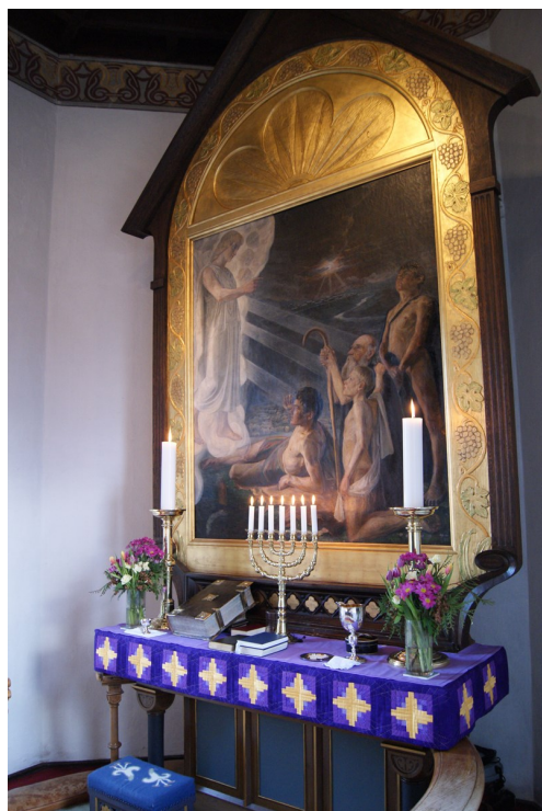
Bering kirkes altertavle

vidner både om hans stædige flid og om hans store spændvidde fra landskabsmaleri til nature morte, over historiske motiver som Dan-tebillederne, til en lang række selvportrætter, -